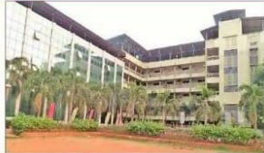
कैम्पस साकेत ज्ञानपीठ.