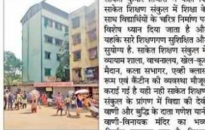
साकेत विद्यामंदिर इंग्लिश हाईस्कूल.